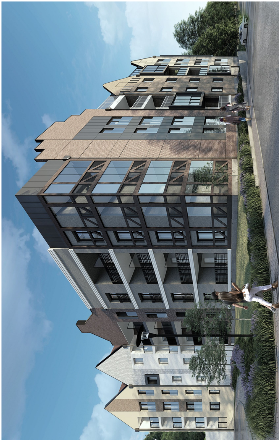
Widok z narożnika ulicy Wapiennej i Bulwaru Zygmunta Augusta

Załącznik Nr 2 do uchwały Nr XX/614/2021 Rady Miejskiej w Elblągu z dnia 4 listopada 2021 r.