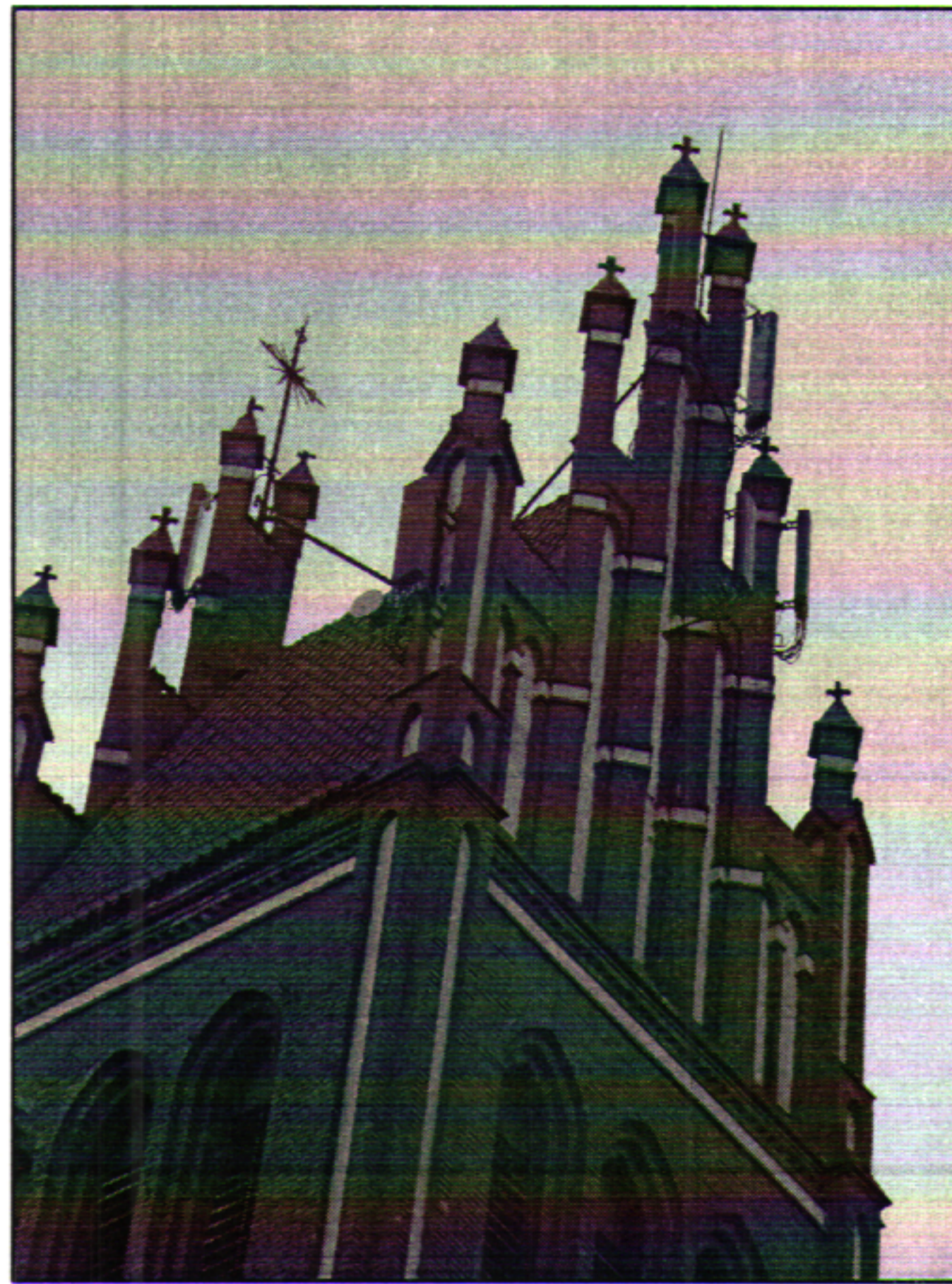
Rys. 4 Widok badanego obiektu