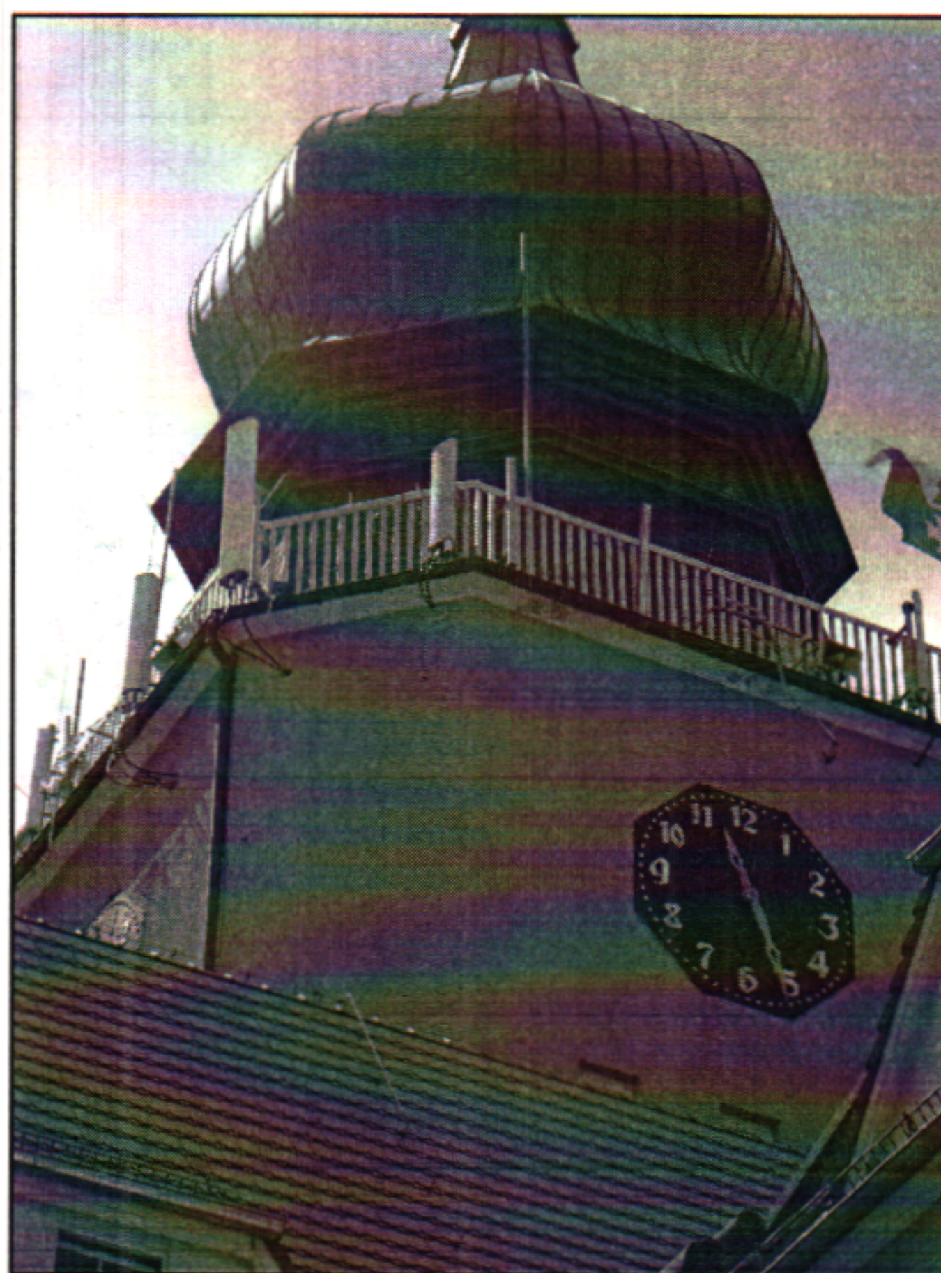
Rys. 4 Widok badanego obiektu